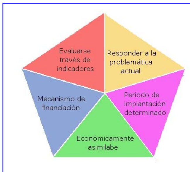
Figura 1: Características que deben cumplir las acciones adoptadas en el PAL.

En lo referente a las acciones del Plan, éstas se encuentran condicionadas a las conclusiones obtenidas tras la realización del Diagnóstico Ambiental Municipal, herramienta utilizada como fuente para dilucidar los diferentes tipos de actividades a desarrollar en las distintas zonas del municipio. Además, todas las acciones adoptadas por el municipio deben cumplir los siguientes preceptos: